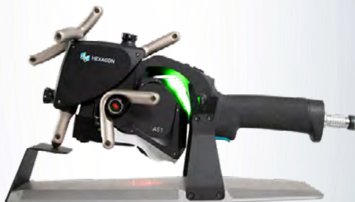
LEICA HEXAGON Hand-Scanner