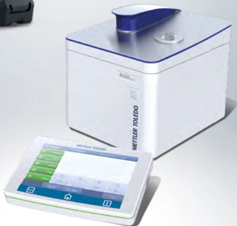
METTLER TOLEDO Laborgerät