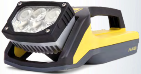
GIFAS ELECTRIC Arbeitsleuchte